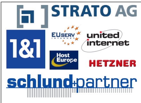
Unsere Webpace-Empfehlungen für den EIDAMO®-Einsatz

Natürlich hat »Sage« die EIDAMO®-Integration auf Herz und Nieren getestet, und dann erst freigegeben. Das Produkt ist eine offizielle »Sage zertifizierte Partnerlösung«.